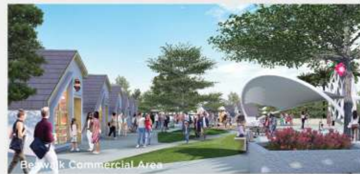
Business Commercial Area

Setelah berhasil mengembangkan Kota Gading Serpong, Paramount Land mempersembahkan sebuah kota mandiri baru di Barat Jakarta dengan luas ±400 ha dengan fasilitas yang lengkap, Paramount Petals.