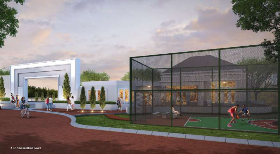
3 on 3 basketball court