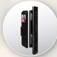
Smart Door Lock with Camera