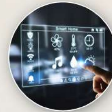
Smart Home System