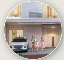
Canopy with Sky light