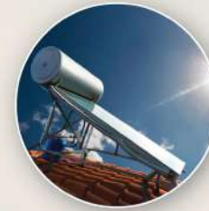
Solar Water Heater