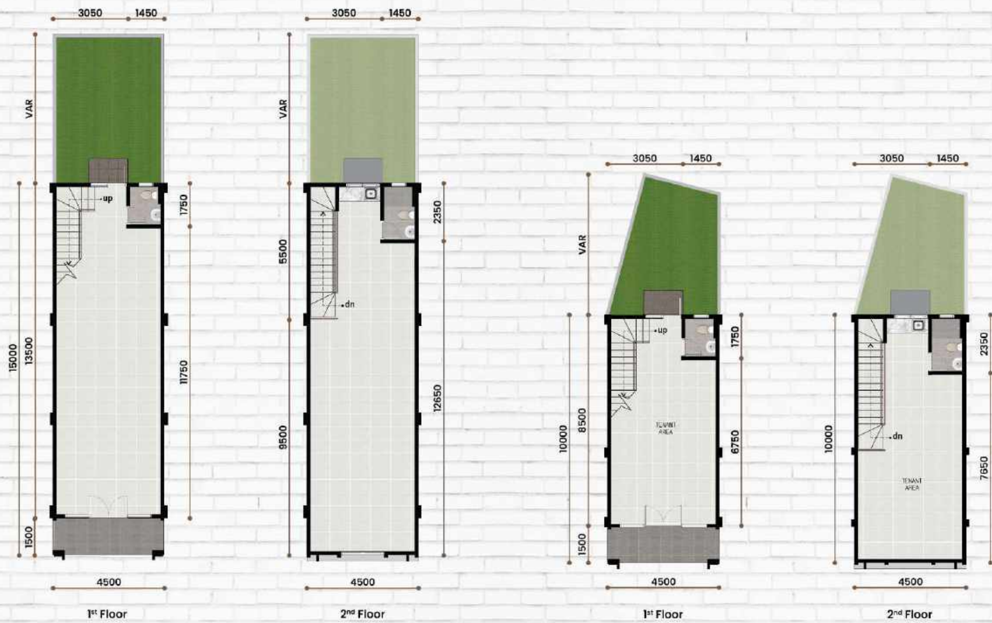
Standard Type 4,5 x 19 | 21 LT: Var | LB: 136 m 2