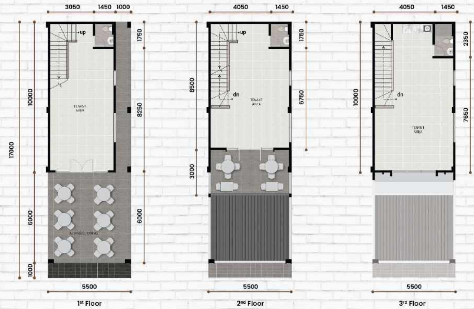
Corner Type 5,5 x 17 LT : 93,5 m 2 | LB : 181 m 2