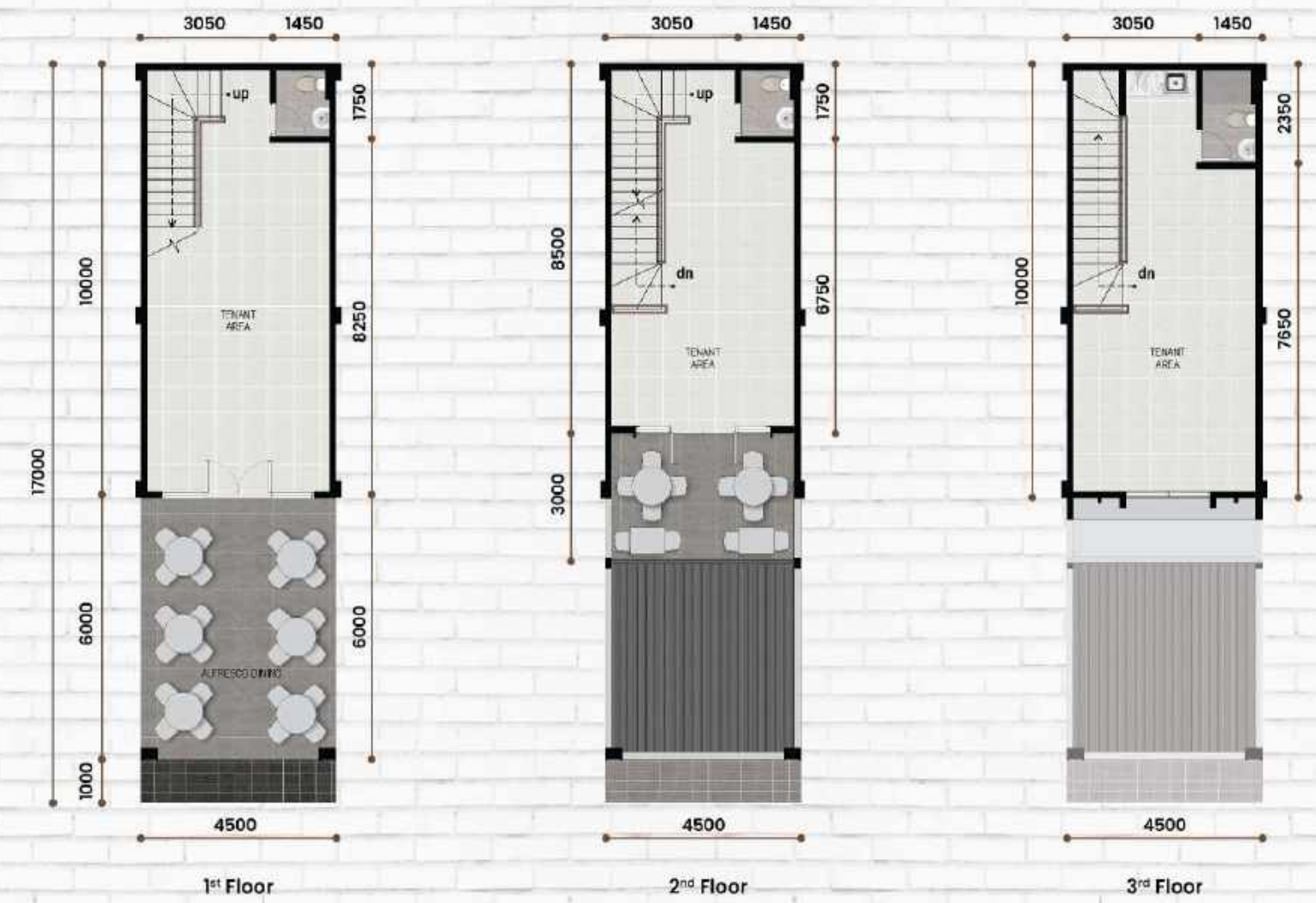
Standard Type 4,5 x 17 LT : 76,5 m 2 | LB : 153 m 2