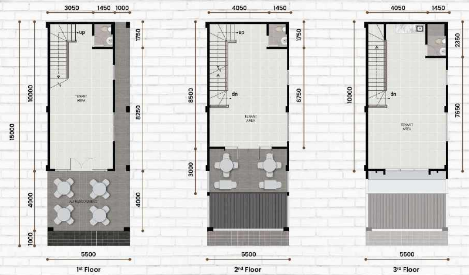
Corner Type 5,5 x 15 LT : 82,5 m 2 | LB : 176 m 2