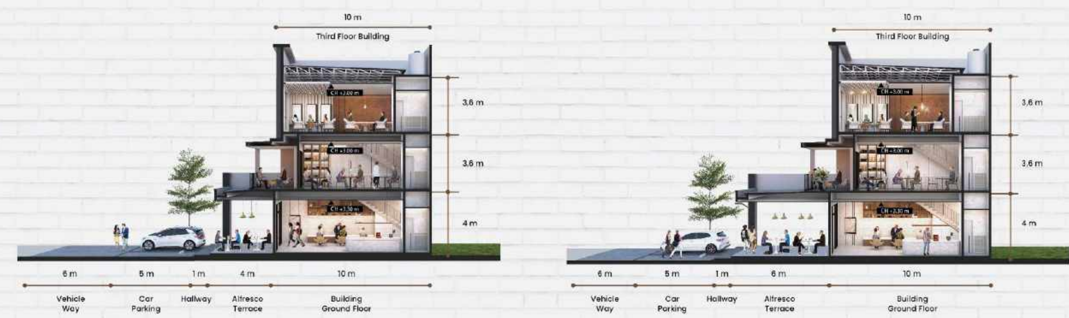
LENGTH 17 METER (3 FLOOR)