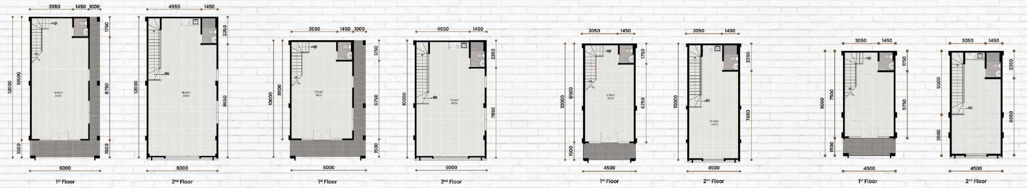
Corner Type 6 x 12 LT : 72 m 2 | LB : 144 m 2