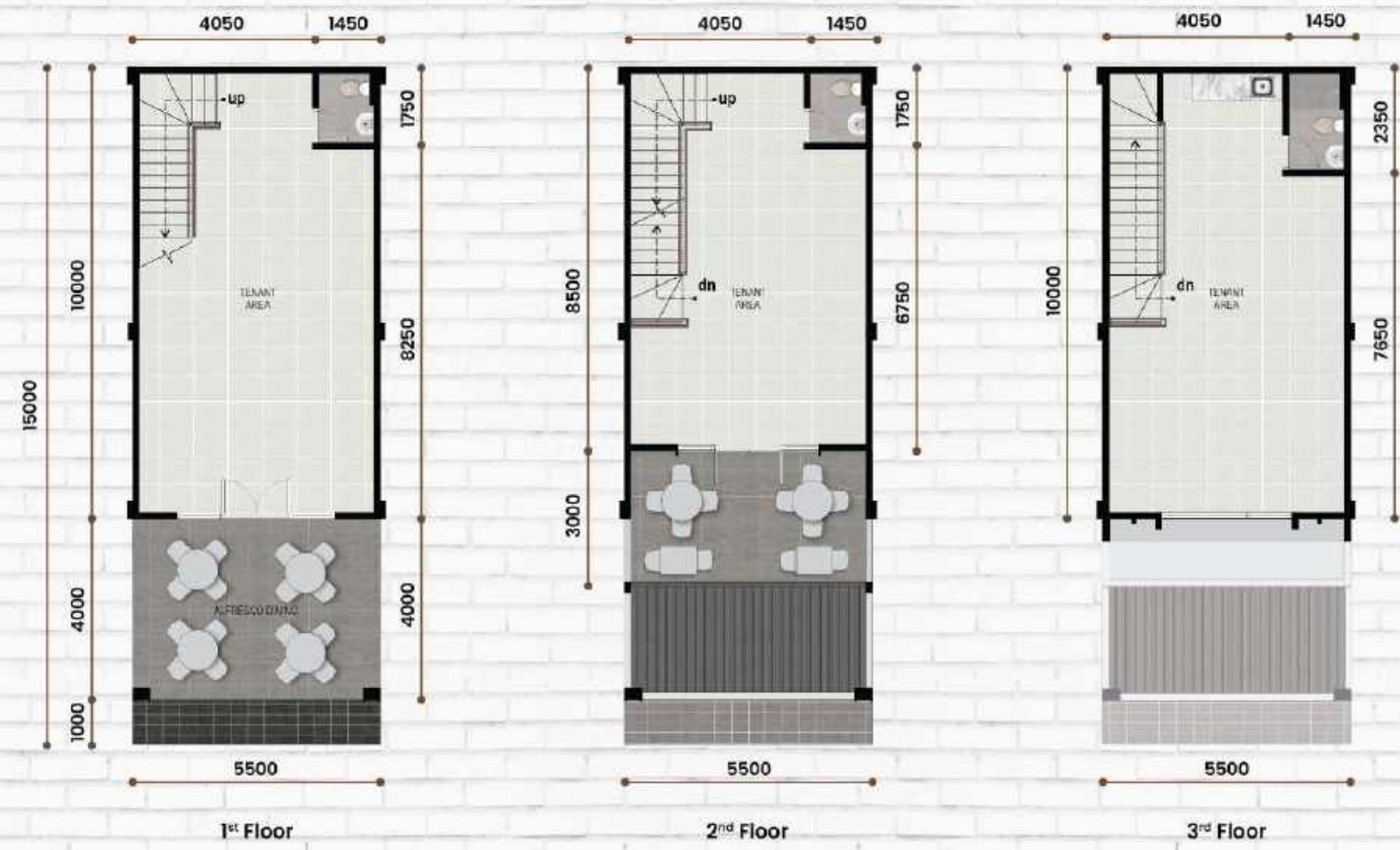
Standard Type 5,5 x 15 LT : 82,5 m 2 | LB : 181 m 2