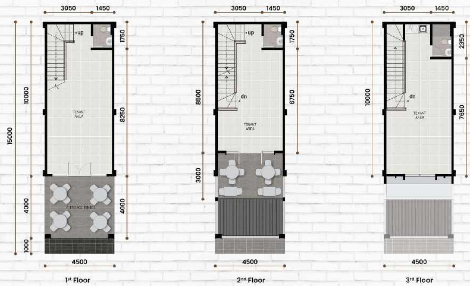
Standard Type 4,5 x 15 LT : 67,5 m 2 | LB : 148 m 2