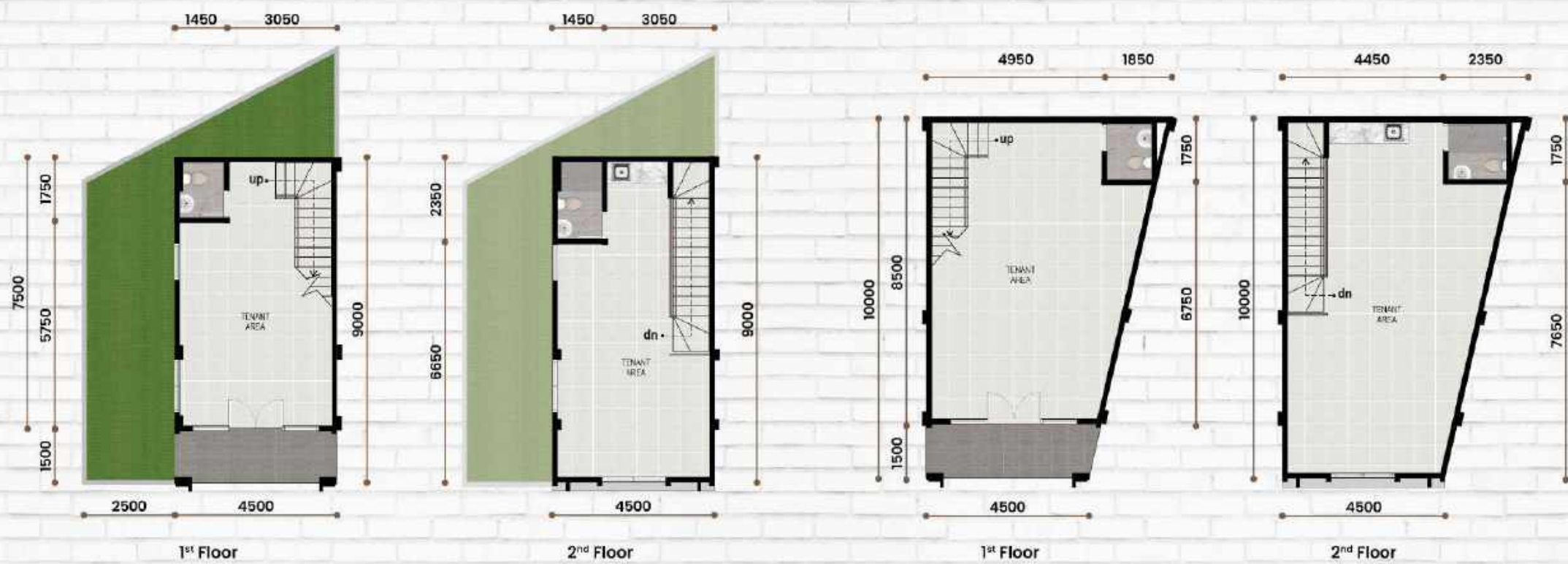
Standard Type 7 x 8 (Irreg) LT: 71 m 2 | LB: 81 m 2