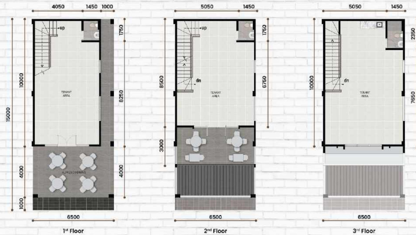
Corner Type 6,5 x 15 LT : 97,5 m 2 | LB : 209 m 2