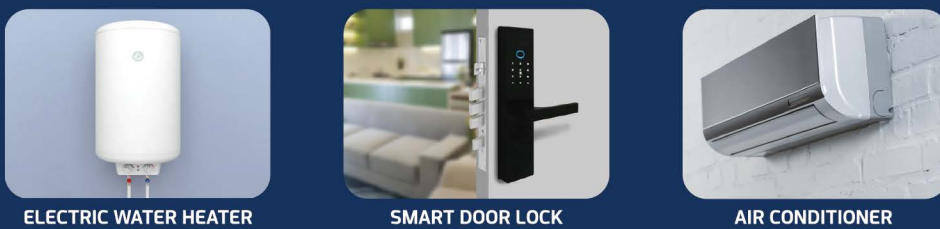
ELECTRIC WATER HEATER | SMART DOOR LOCK | AIR CONDITIONER

Disclaimer : Segala daya upaya telah dilakukan dalam mempersiapkan materi promosi ini. Namun demikian, pihak pengembang, PT Paramount Enterprise International beserta seluruh agennya mengingatkan bahwa setiap pernyataan, informasi maupun data dapat mengalami perubahan sejalan dengan proses perencanaan yang berkesinambungan. Semua ilustrasi / artist impression adalah semata hasil terjemahan dari rencana arsitektur ke dalam bentuk gambar atau fotografi yang merupakan hasil rekaan dengan menggunakan model / contoh.